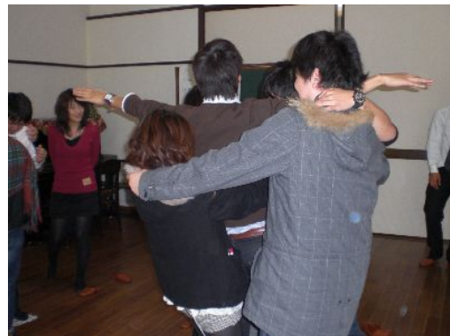
チームワークが大事なレクリエーション