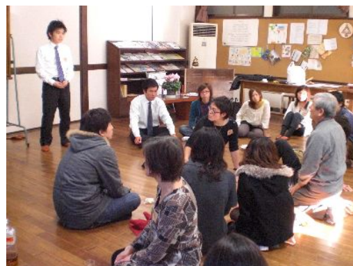
ボランティアってなんだろう・・・