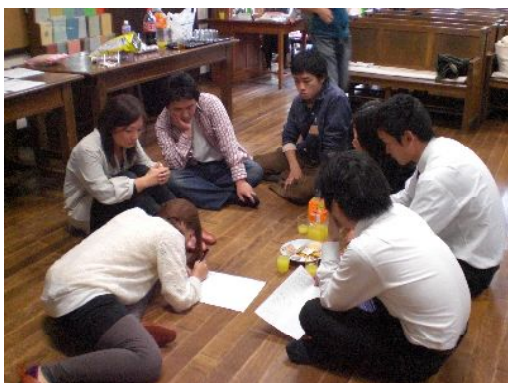
悩むみんな。うむむ・・・