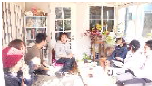
光たくさんのバルコニー

A1. 薬は置いていないが、それは仕方ない事。F I でみれる予算ではないし。 でも、清潔に保てていたし、浄水器も置かれたいた。現在は、アメリカの NGOがフィーディングプログラムを開催する場所としても機能している。