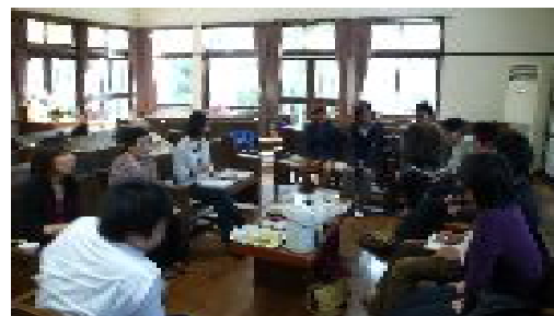
メンバーは徐々に集まる